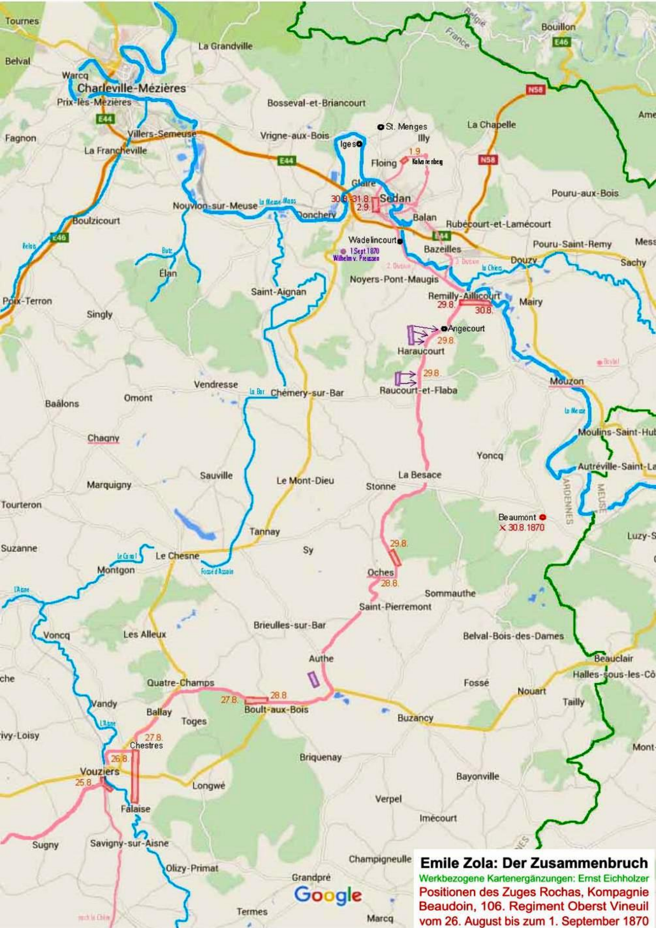
Emile Zola: Der Zusammenbruch Werkbezogene Kartenergänzungen: Ernst Eichholzer Positionen des Zuges Rochas, Kompanie Beaudoin, 106. Regiment Oberst Vineuil vom 26. August bis zum 1. September 1870