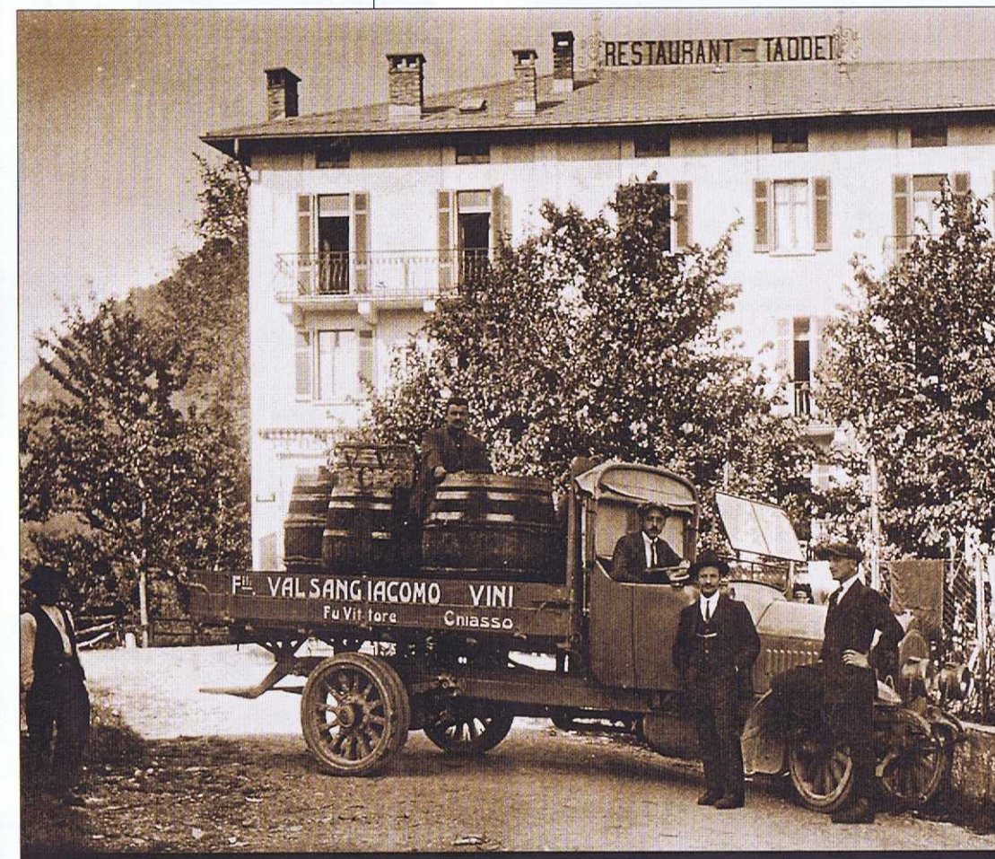
DIE ERSTEN SCHRITTE Auf dem Bild links ein ganz junger Cesare Valsangiacomo