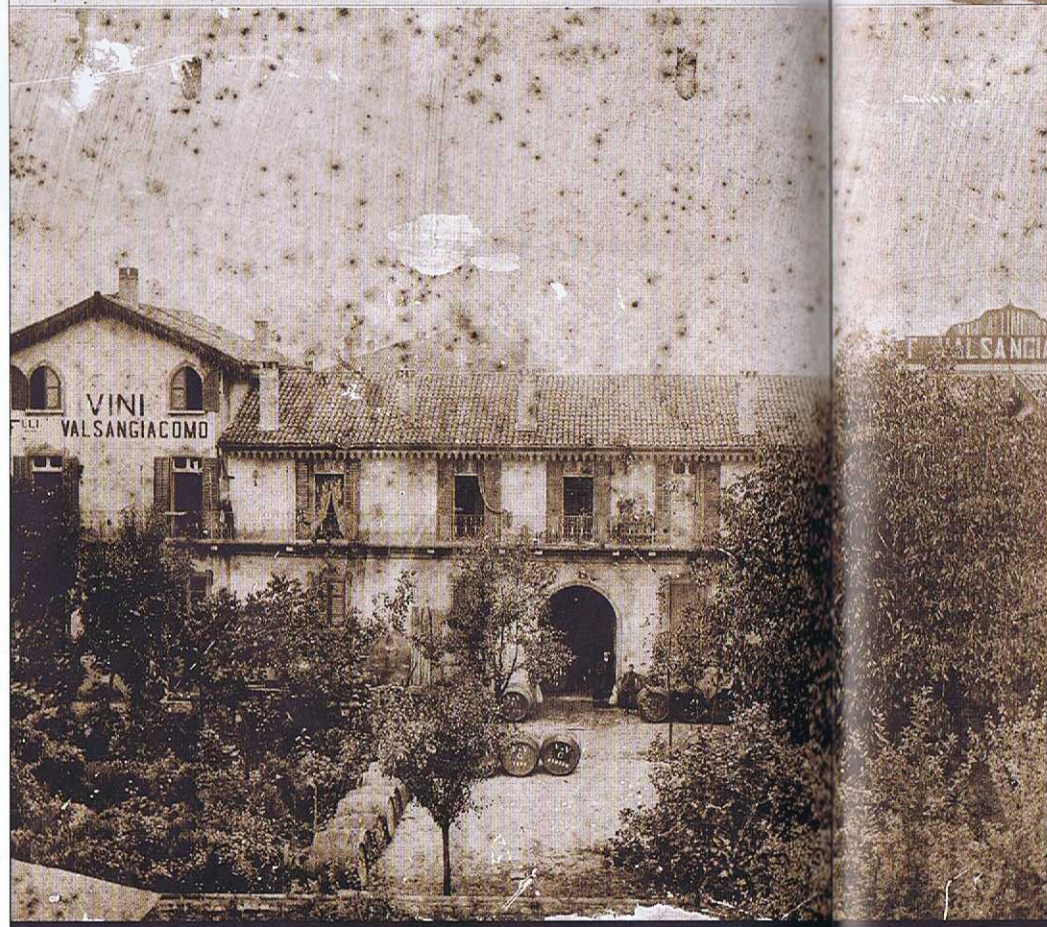
EIN TRADITIONSREICHES UNTERNEHMEN Eine vergilbte Aufnahme der alten Kellerei