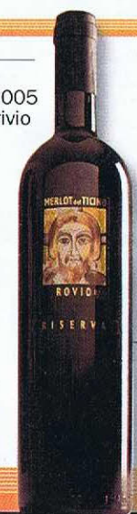
Rovio Riserva Merlot del Ticino 2006 Vini Rovio Ronco, Rovio