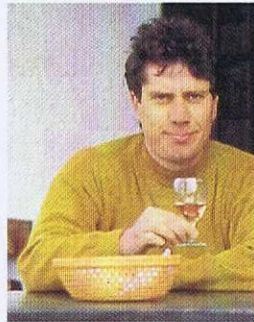
Grotto Collina S.+E. Ferrari-Hostettler 6981 Termine Tel. 091/73 24 78

Der Weg hinauf zum Grotto Collina in Termine di Monteggio, nur einen Steinwurf von der italienischen Grenze entfernt, ist steil und steinig. Aber die mühsame Autofahrt lohnt sich: Von der grossen Terrasse des Restaurants aus geniesst der Besucher eine fantastische Sicht auf die Hügel im Vordergrund und die Alpen mit dem schneeweissen Monte-Rosa-Massiv im Hintergrund. Hier oben atmet man unwillkürlich tief ein – die Weite hat etwas Befreiendes, Wohltuendes. Wenige Mo-